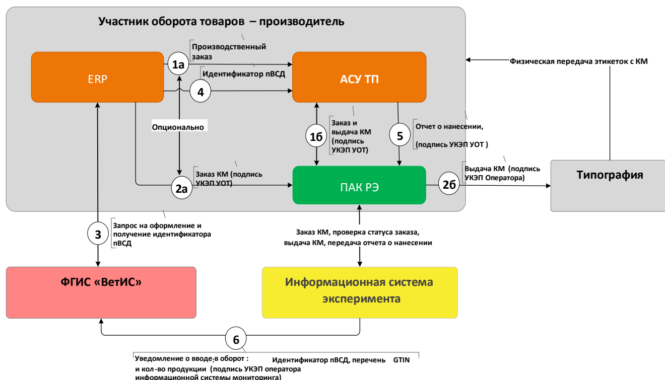
Рисунок 1. Модель взаимодействия. Вариант 1