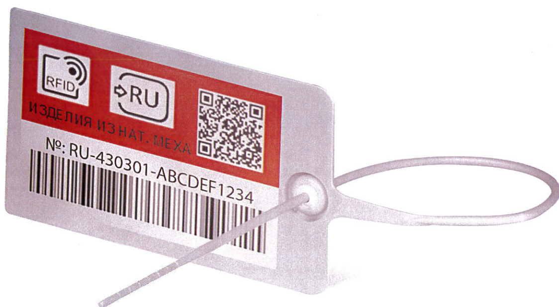
Рис 3. Пример изображения контрольного (идентификационного) знака для навесного (накладного) способа крепления на товар.